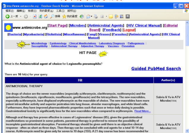
專利 Smart Search® 搜尋引擎