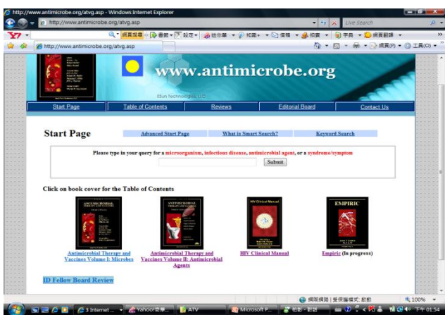
簡單易學搜尋首頁